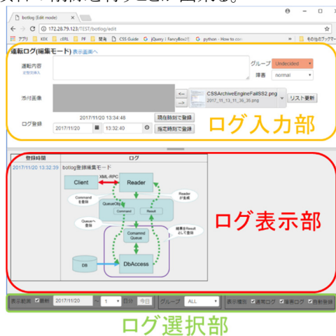
Figure 2: 編集モード画面

また、過去に入力した内容を変更する場合には、ログリスト内の登録日付時刻へのリンクをクリックする。変更用ダイアログがポップアップ表示されるので、そこで編集作業や項目の削除を行うことができる。