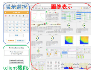
Figure 5: 画像ログシステム Web 画面

この Web 画面には画像登録の Client 機能がついている。クリップボードに画像をコピーしたのちに”Paste clipboard image or Drop image file”の部分で”貼り付け”をするか、画像ファイルをドラッグ&ドロップすると登録確認ダイアログが表示される。ダイアログ上でキャプションを入力し、登録ボタンを押下すると、画像が登録される。また、同等の機能を持つ Windows 版の Client プログラムも作成してあるので、ダウンロードして使用することも可能となっている。Fig.5 に実行例を示す。