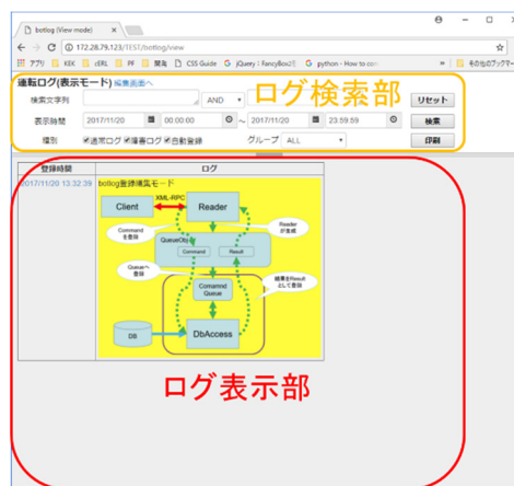
Figure 3: 閲覧モード画面

閲覧モードでは時間降順に表示するため主として表示後に紙媒体に印刷し・保存する用途に適している。