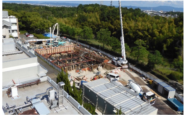
Figure 3: Construction of new building for 211At distribution.

学、学校法人関西医科大学、学校法人藤田学園であり、産学連携の協力機関として大阪府、住友重機械工業、アルファフュージョン株式会社が参画している。この拠点が完成し、多くの 211At を供給することにより、アルファ線核医学治療のさらなる研究の発展と治療への貢献が可能になるものと期待されている。現在、建屋の建設が 2024 年 2 月の竣工を目標に急ピッチで進められている(Fig. 3)。