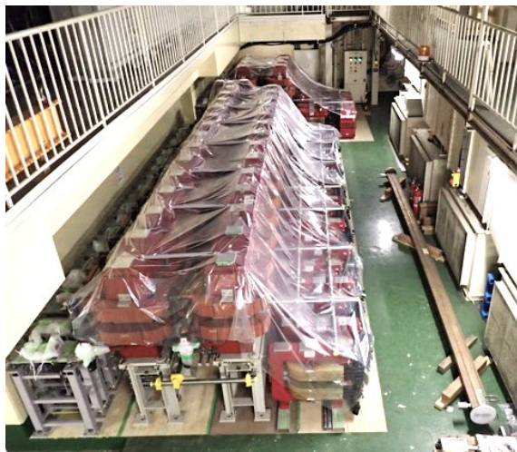
Figure 2: The removed wiggler magnets

後直線部中央部分から順にウィグラー電磁石をビームラインから取り外し大穂直線部架橋下のスペースに並べ保管している(Figure 2)。特にダブルポール電磁石は、将来 HER ラインで使用できる可能性があるため、ホローコンダクター内に窒素ガスをパージして保管を行っている。