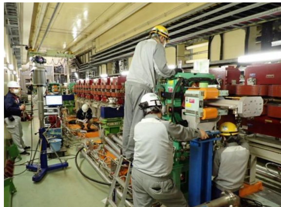
Figure 4: Alignment of quadrupole magnets

製作されたもので高さは床面からおよそ 120 mm である。今回の再配置で 90 mm プレートに乗っていた四極電磁石を 120 mm プレートに設置する必要があった。そのまま設置すると磁石中心がビームラインより上になり、架台の調整範囲を超えてしまうため、120 mm プレートに設置する四極電磁石の架台を数十ミリ短くする加工を行った。架台加工が終わった後、架台のアライメントを行い、レーザートラッカーを用いて電磁石の精密アライメントを行った(Figure 4)。