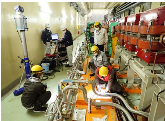
Figure 3: Marking the center of the electromagnet and the tapped hole position

大穂直線部には高さの違う2種類ベースプレートが存在する。1つは KEKB 時代に製作された床面から高さ 90 mm ほどのベースプレートで、改造前の四極電磁石はこのプレートに設置されていた。もう1つは、SuperKEKB 時代にウィグラー電磁石を設置するために